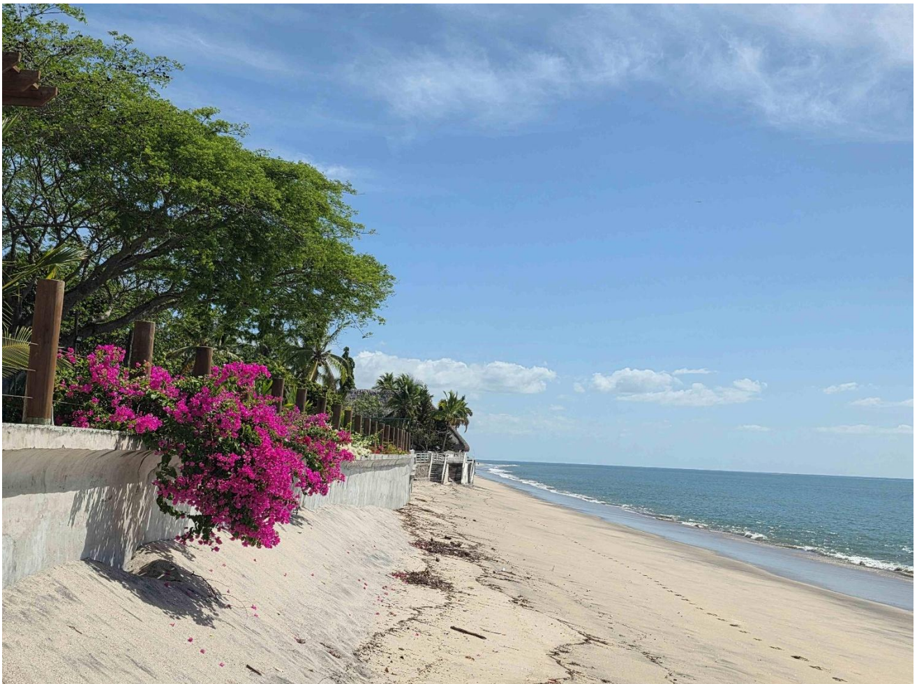
Naturstrände am Pazifik, Panama