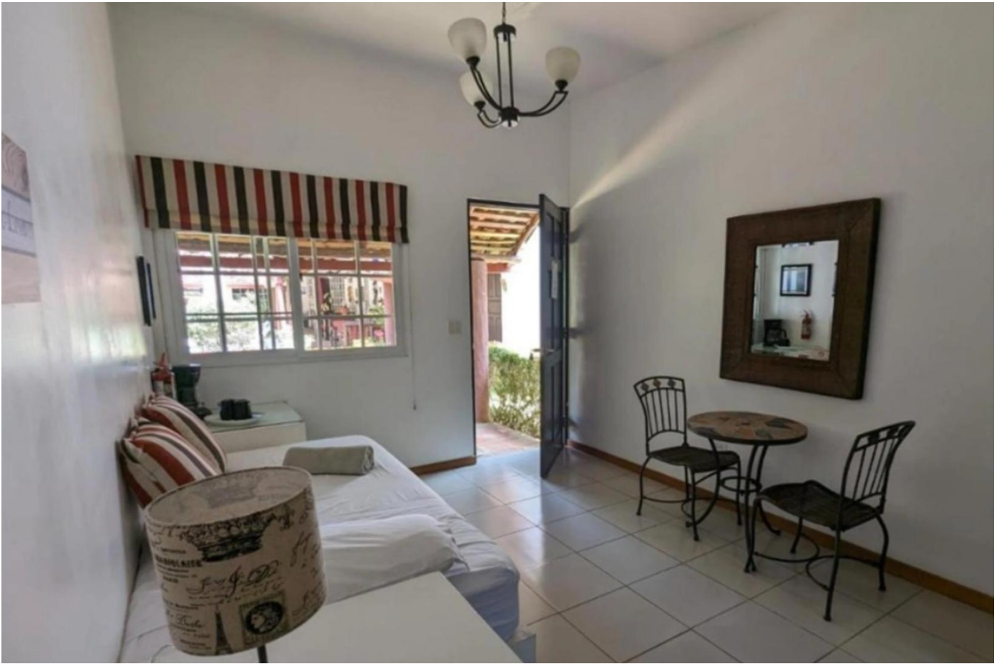
Zimmerbeispiel Villa Botero