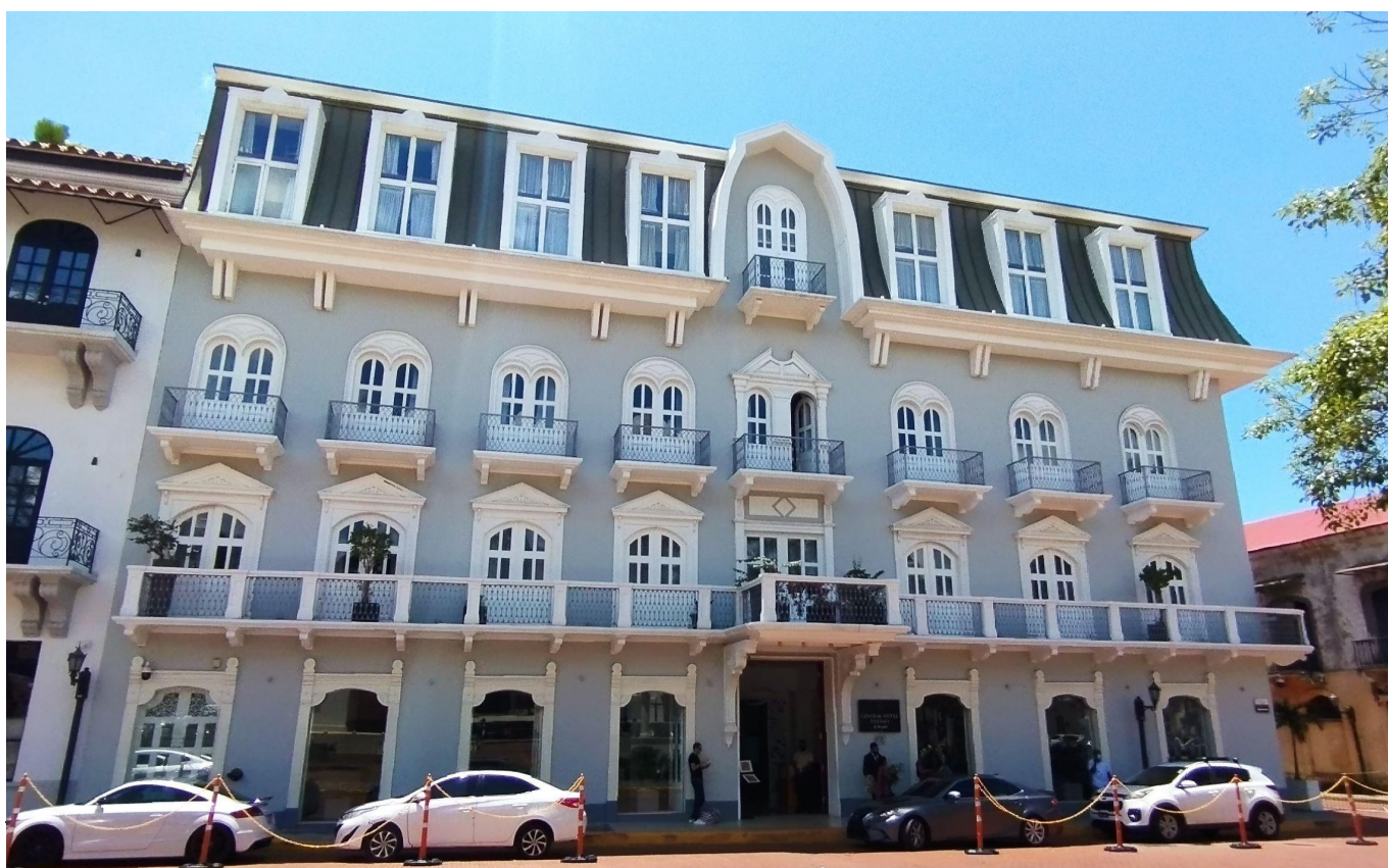
Obere Bilder: Altstadtbereich von Panama-City, wo sich unser Boutique-Hotel Zentral befindet.