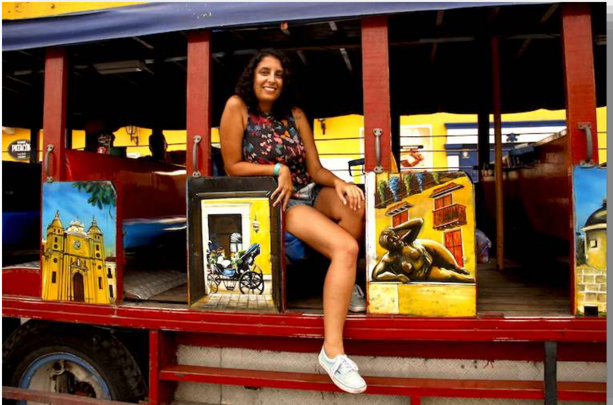
Einzigartig, koloniale Innenstadt von Cartagena de Indias