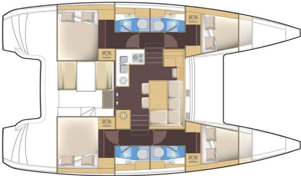
version premium 4 cabines 4 sdb - 4 cabin 4 head premium version