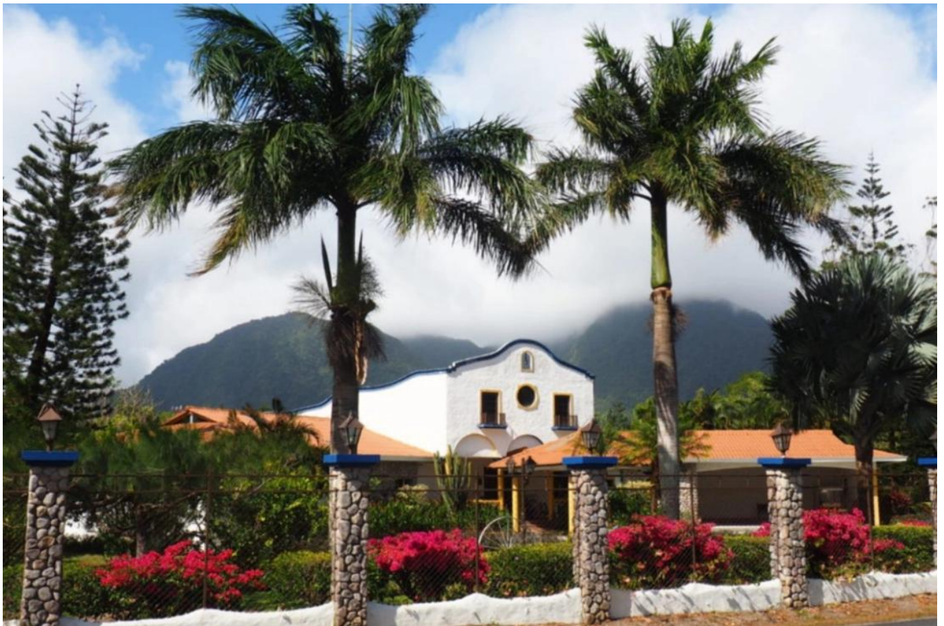
Valle de Anton, Panama

2 Ü/F im süßen Hotel The Golden Frog Inn , Valle de Anton.