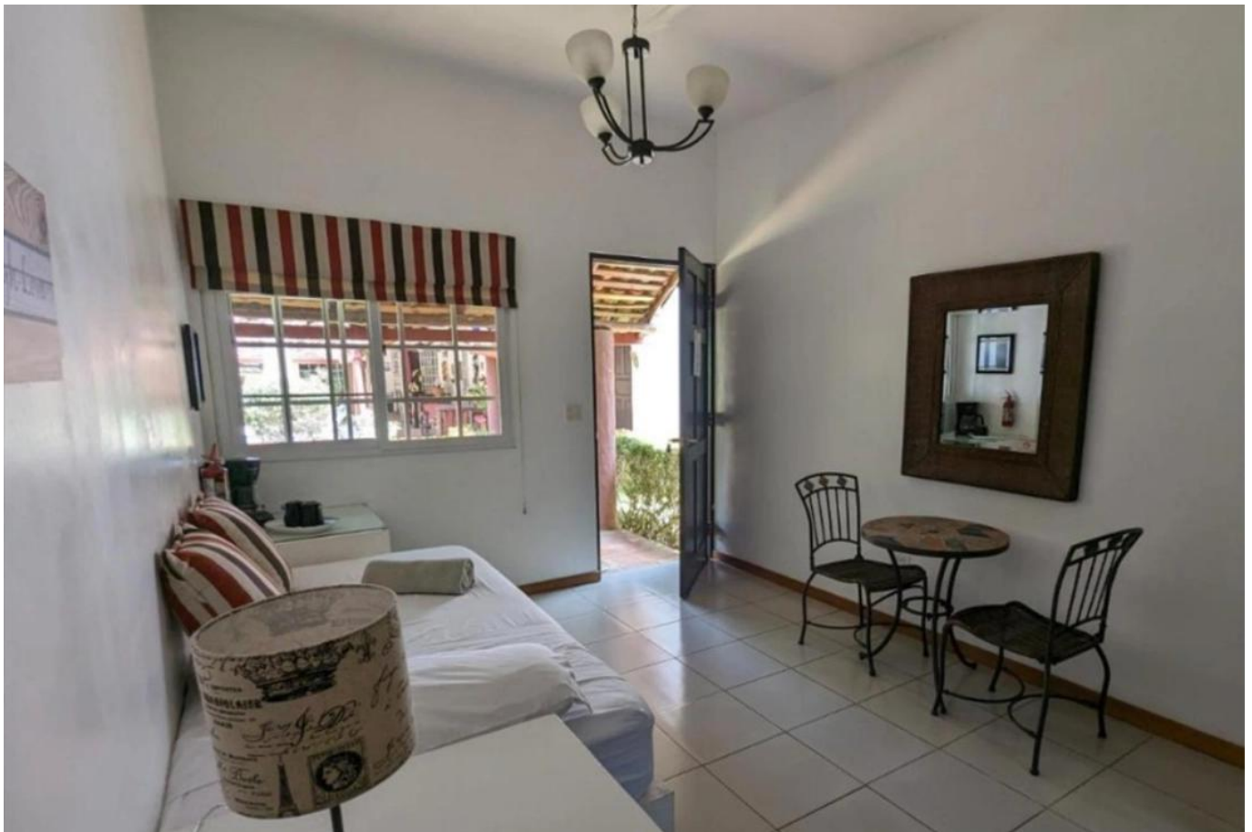
Zimmerbeispiel Villa Botero