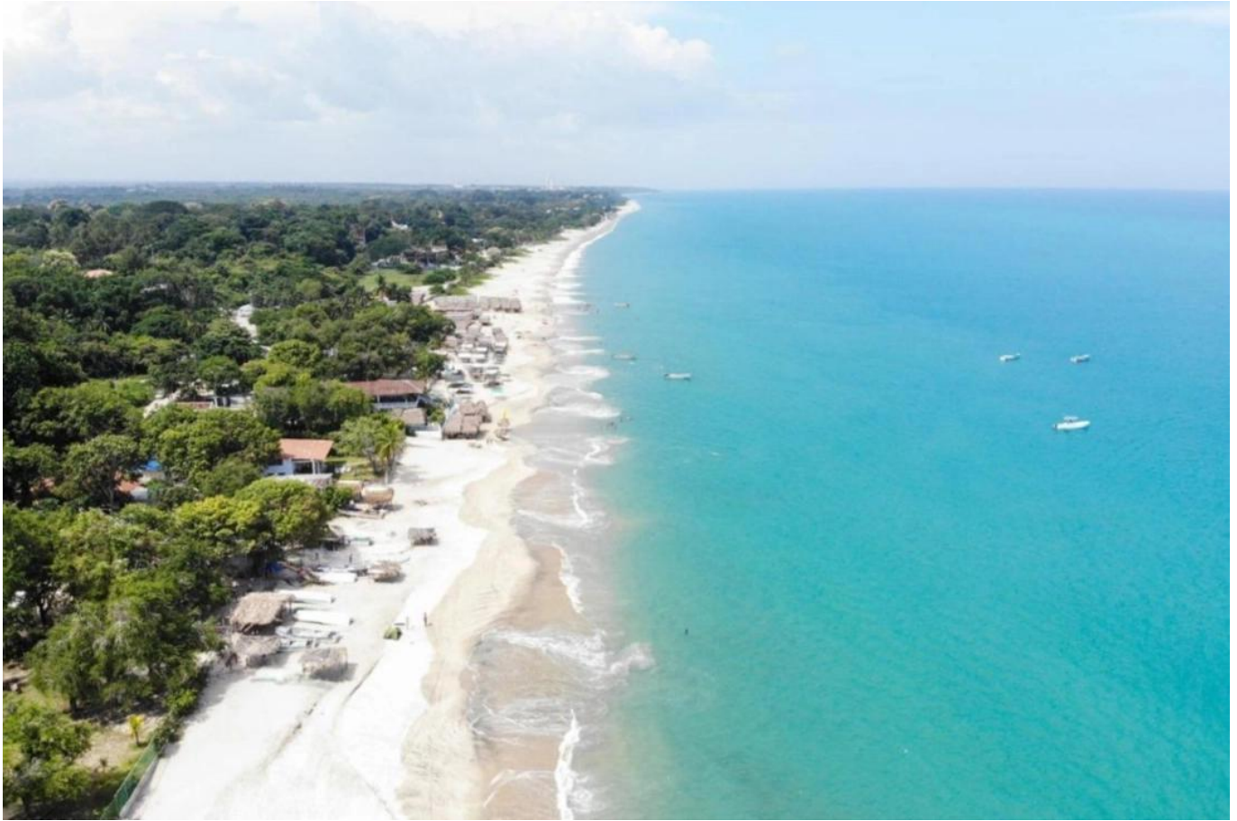
Naturstrände am Pazifik, Panama

Hinweis: Panama ist im Aufbruch, was den internationalen Tourismus angeht. Dieses mittelamerikanische Land hat eine außerordentlich reizvolle Natur. Bei dem Hotelstandard darf man nicht mit "Sterne"-Kategorien in Europa vergleichen. Die traumhafte Ursprünglichkeit in Panama wird unvergesslich bleiben!